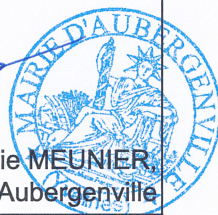
Virginie MEUNIER, Maire d'Aubergenville