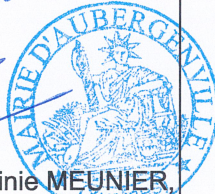
Virginie MEUNIER, Maire d'Aubergenville