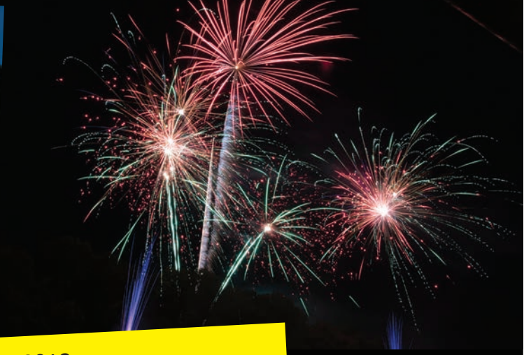
le 13 juillet 2018 Fête Nationale et Feu d'artifice