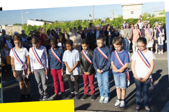
le 18 juin 2018 Cérémonie de l'Appel du 18 juin