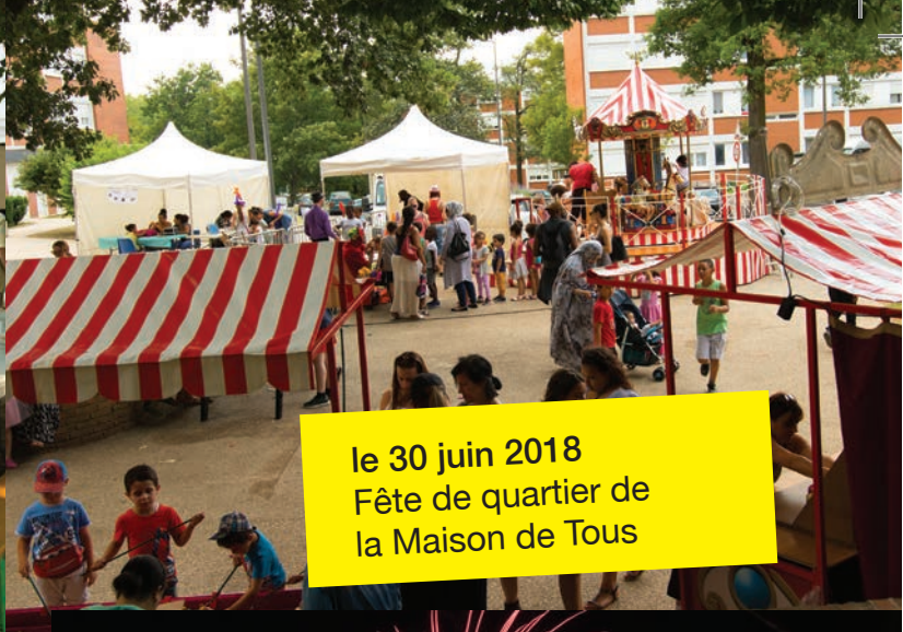
le 30 juin 2018 Fête de quartier de la Maison de Tous