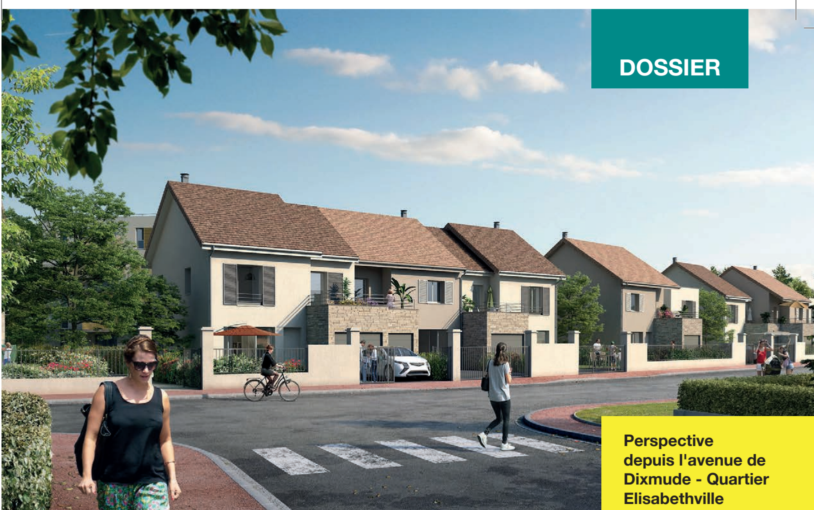
Perspective depuis l'avenue de Dixmude - Quartier Elisabethville

le cœur des activités économiques. De nouvelles entreprises se sont installées le long de l'A13 dans la zone des Chevries et dans le Clos Reine. Dans quelques mois, un nouveau dossier pour l'extension de Family Village sera déposé. Parallèlement, un travail de fond sur le commerce de proximité est mené à travers la négociation d'un plan ambitieux de rénovation du centre commercial d'Acosta ; et le développement économique dans le bourg historique se définit peu à peu, grâce à des acquisitions réalisées l'an dernier sur la place de l'Église.