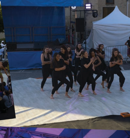
le 21 juin 2018 Fête de la musique