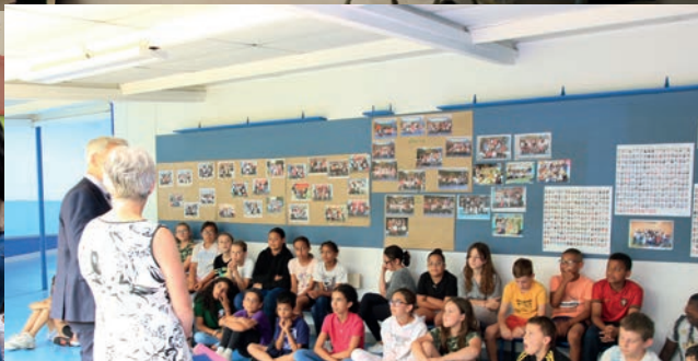
Remise des calculatrices aux élèves de CM2