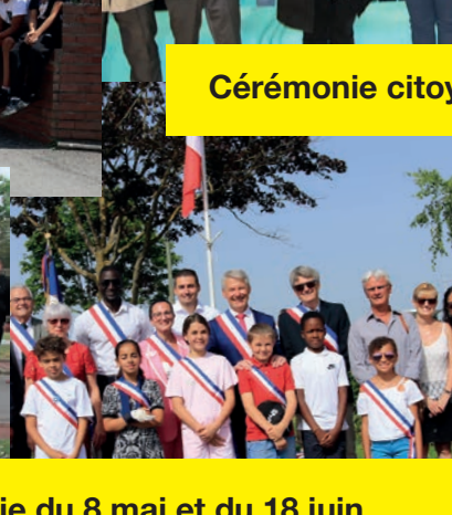
Cérémonie du 8 mai et du 18 juin