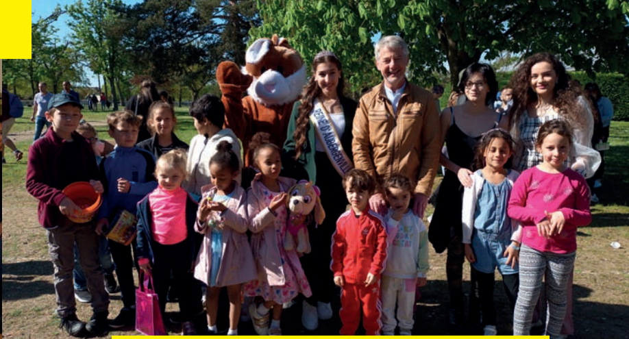
La Chasse aux Œufs avec l'Association Animation Elisabethville