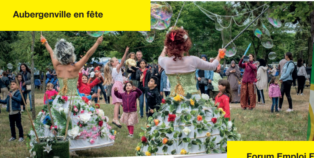
Aubergenville en fête