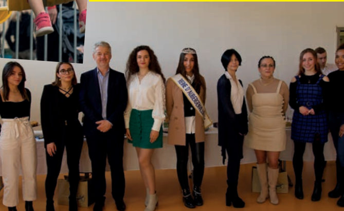
Élection de la Reine d'Aubergenville