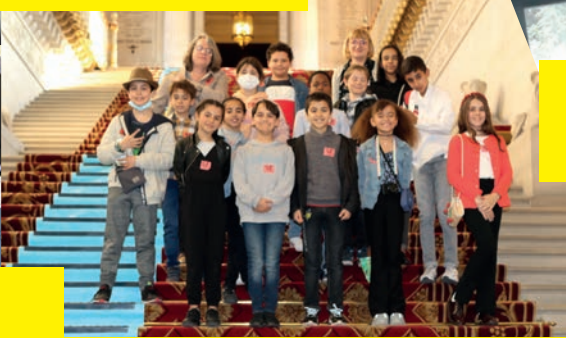
Visite du CME au Sénat et au Mont Valérie