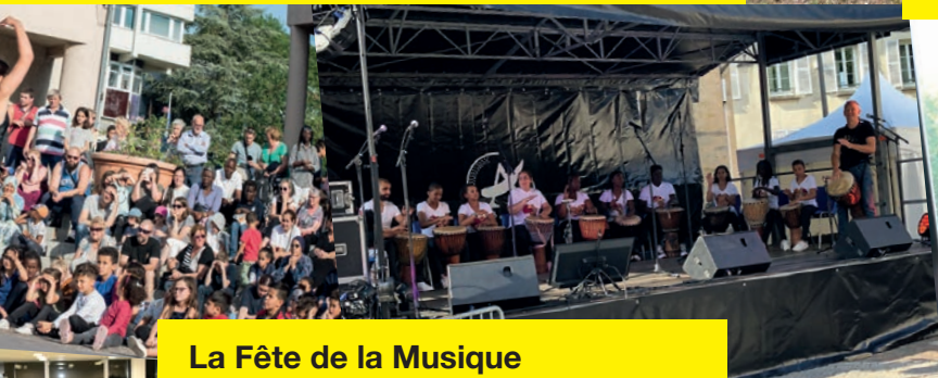
La Fête de la Musique